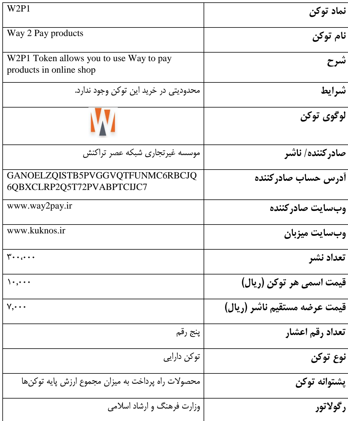
جدول مشخصات توکن راه پرداخت (W2P1)

این توکن مبتنی بر بستر شبکه ققنوس و با نماد W2P1 صادر خواهد شد. مشخصات و جزئیات این توکن در جدول زیر آمده است: